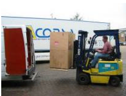
Het transport van de PC's in Nederland

De school naast het hoofdkantoor herbergt nu naast de vertrouwde opleidingen ook een aantal nieuwe administratieve opleidingen. De 25 PC's (XP) en beeldschermen die we in maart verstuurd, komen daar heel goed van pas.