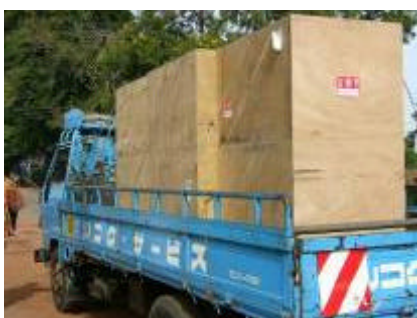
Het transport van de PC's in Uganda

De luchtvracht van de PC's werd gratis verzorgd door transportonderneming BBC uit Brabant. Voor de transportkosten in Uganda (ongeveer 1500 euro) zoeken wij nog één of meerderé enthousiaste sponsor(s)!