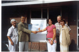
overhandiging van de cheques