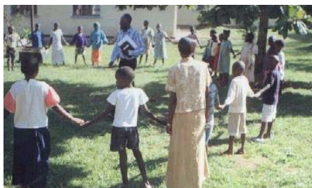
Bijbelonderwijs en spelen in de zon

ma ging een groep van 188 sponsorkinderen rond de jaarwisseling op kinderkamp. Vanwege gebrek aan financiële middelen was het alweer 8 jaar geleden dat een kinderkamp voor het laatst was georganiseerd. Dit kamp werd echter mogelijk gemaakt dankzij de gulle gift van een spon-