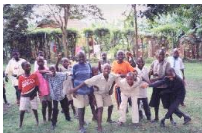
De kinderen genoten van sport en spel

"Want Ik weet welke plannen ik voor u heb, zegt de Heere" (Jer. 29-11a). Met dit the-