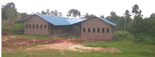
Het nieuwe meisjesinternaat (2007)

De bouw van het meisjesinternaat vordert gestaag. Met hulp van onze eigen studenten van de technische school zijn we al zo ver dat het dak dicht is. Nu worden de muren gepleisterd en kan de verdere afwerking beginnen. We hopen dat bij de diploma-uitreiking op 9 november van dit jaar het gebouw officieel kan worden geopend!