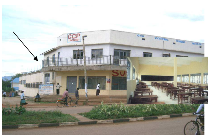
Het grote schoolgebouw, waar links bovenop de 3 nieuwe lokalen komen

Bij de technische school willen we het toegenomen aantal studenten de ruimte bieden voor praktijklessen door drie extra workshops te bouwen.