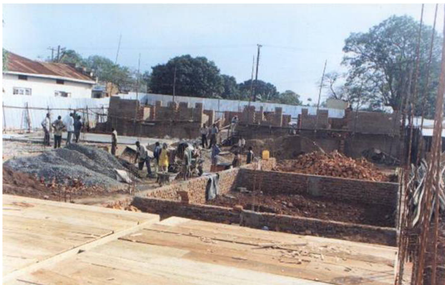
Bouwen in Uganda is vooral handwerk

We houden u op de hoogte van de verdere ontwikkelingen in de bouw van de school en de timmerlokalen!