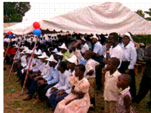
De school voor beroepsopleiding telt nu 300 leerlingen

Voor een prijs waar we in Nederland alleen maar van kunnen dromen, werd een tweede stuk grond gekocht om daarop de lokalen voor de timmeropleiding en in de toekomst de andere technische opleidingen te realiseren. Omdat de school vlakbij het ziekenhuis staat en omdat de geluidsoverlast van de zaagmachines de andere lessen te veel zou verstoren, moesten de technische richtingen op een andere locatie worden gebouwd. Op ditzelfde stuk grond willen we dan in de toekomst ook het internaat bouwen waar de studenten die buiten de stad wonen, kunnen logeren. Er loopt een aanvraag voor de